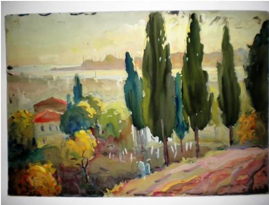
Петър Дачев, Неозаглавена картина, гваш акварел, 47/32 см, инв. № 1301-62 Регионален исторически музей – Добрич, Дом-паметник „Йордан Йовков“, фонд 1341 (о) ПД

Кипариси в гробището Еюб султан, поглед от хълма на Пиер Лоти към Златния роги края на историческия полуостров.