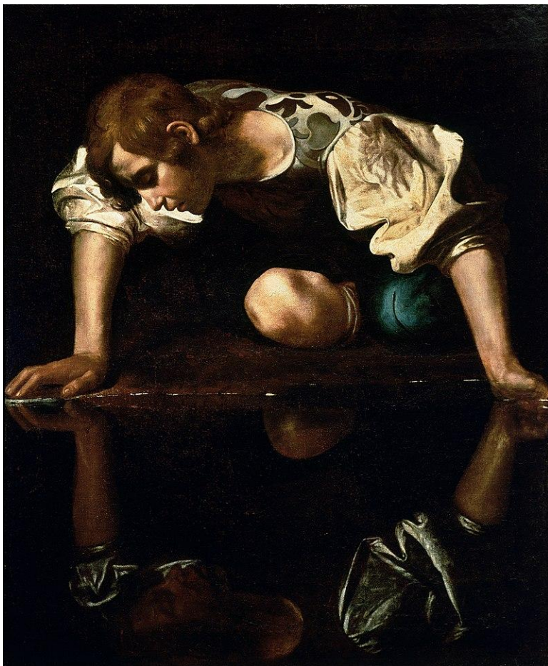
Микеланджело да Караваджо, „Нарцис“, 1590 Национална галерия за старинно изкуство, Рим

възможен чрез поетическото вглеждане в себе си. Именно поезията в своята художествена функция осигурява този специфичен разрив, това своеобразно отделяне от собствено своето чрез фикционализирането на света и на аза.