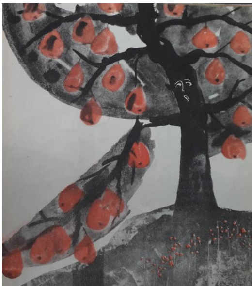
Илюстрации към книгата „Малка повест за птичето, семката и младата крушка“ от Здравко Сребров. Художник Борислав Стоев. София, 1963