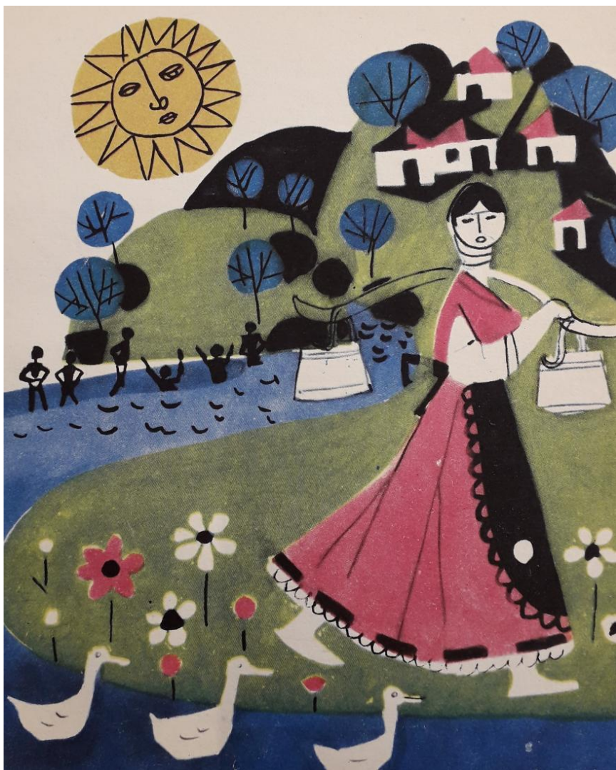
Илюстрация към книгата „Сладкопойна чучулига“ от Цоню Калчев. Художник Мана Парпулова. София, 1968

Стремежът към „осъвременяване на традициите“ обаче води до уеднаквяване на художественото оформление на изданията, които се изпълват с еднотипни изображения.