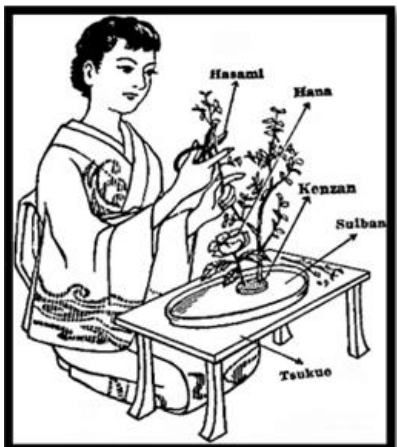
17) Ватанабе Съотей, Птица на райска ябълка; 18) Икебана стил Морибана; 19) Кензан

Всяка композиция Морибана изразява символно трите основни елемента: 1) Син – небе, изразен чрез най-дългия елемент; 2) Со(е) – човек, означен от елемента със средна дължина; 3) тай – земя, вълпътена от най-късия елемент. Триадата небе – човек – земя разкрива изключително възвишена и поетична душевност. Но всичко се полага върху методични и прагматични правила: съотношението на