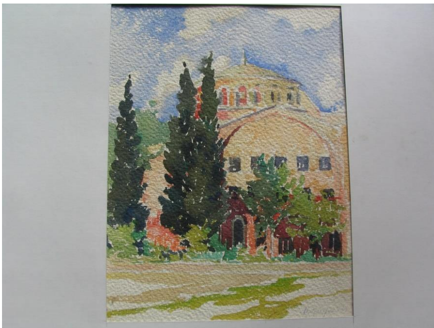
Чудомир, „Света Ирина“, акварел, 24/31 см. Литературно-художествен музей „Чудомир“, Казанлък

През 1932 година, когато Чудомир посещава Цариград, в споменатия християнски храм от византийския период се помещава Военният музей, който с етнографската си експозиция силно впечатлява автора. Акварелът вероятно е нарисуван след завръщането от екскурзията. Куполът на храма е проециран на фона на синьото истанбулско небе, вляво са нарисувани три извисени кипариса. С цветовете си гама акварелът излъчва майска свежест и сякаш отразява невероятната истанбулска пъстрота.