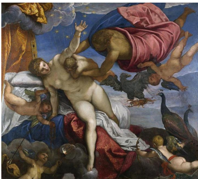
Якопо Тинторето, „Произходът на Млечния път“, 1575, Национална галерия, Лондон

покровителка на брака и на майките по време на раждане. Така още с появата си цветето лилия бива натоварено в съзнанието на хората със силна женска символика – едно наследство, което Лилиев, запазвайки псевдонима си, ще се опита да трансформира чрез подмяната на митологемите в своето творчество, чрез съзнателното дистанциране на поетическия си свят от женското присъствие (респективно на лилията) и обръщането към митологичните и символните употреби на нарциса.