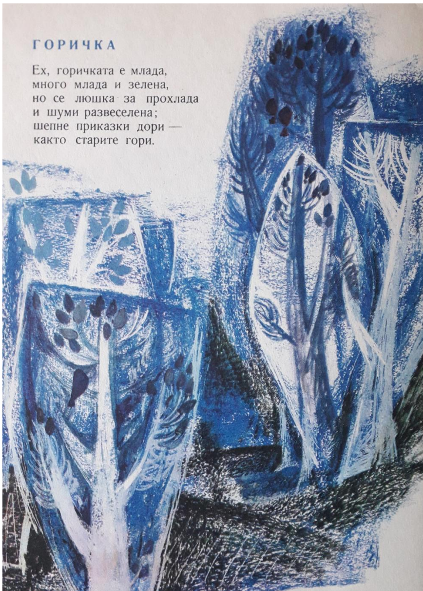
Илюстрация към книгата „Летни пътечки“ от Цветан Ангелов Художник Мира Йовчева. София, 1968

Ех, горичката е млада, много млада и зелена, но се люшка за прохлада и шуми развеселена; шепне приказки дори — както старите гори.