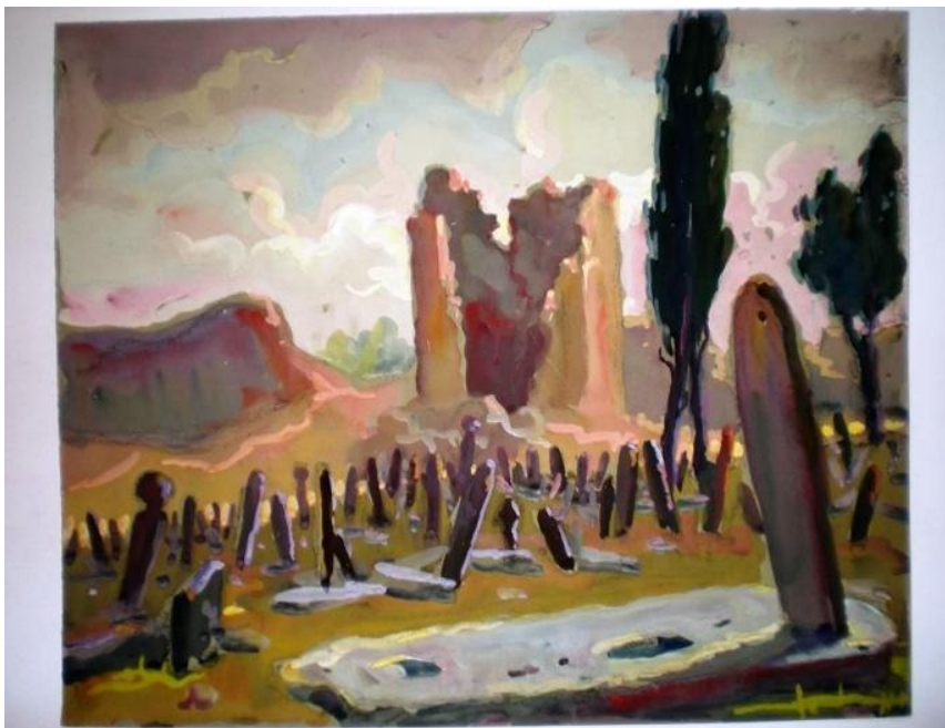
Петър Дачев, Неозаглавена картина, гваш акварел, 27x32 см, инв. № 1301-33 Регионален исторически музей – Добрич, Дом-паметник „Йордан Йовков“, фонд 1341 (о) ПД